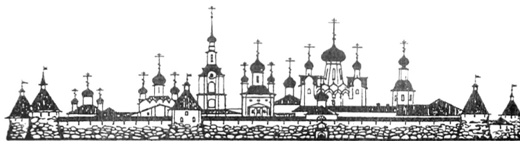
СПАСО-ПРЕОБРАЖЕНСКИЙ СОЛОВЕЦКИЙ СТАВРОПИГИАЛЬНЫЙ МУЖСКОЙ МОНАСТЫРЬ

Соловецкий монастырь по всей своей полноте — то есть XIX столетия — своими высшими точками рождает законченный музыкальный период восьми тактов, с четко разграниченными imitio, motus, termemus . Музыкальная логика «вопрос-сомнение-вопрос-ответ» повторяет путь моих мыслей от любопытства до насущного вопрошания, через ломаную линию сомнений. Ответа, однако, пока не найдено. Но открытие соловецкой гармонии стремительно приближает меня к постижению души «моих Соловков».